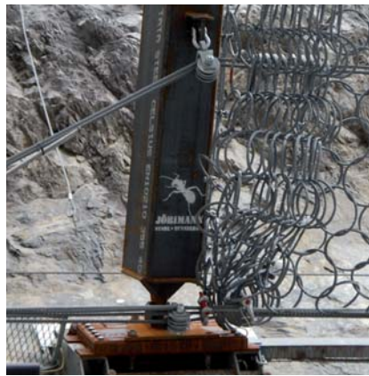
Imagen izquierda: los cables de soporte y de captura de rocas son conducidos prácticamente sin rozamientos a través de poleas